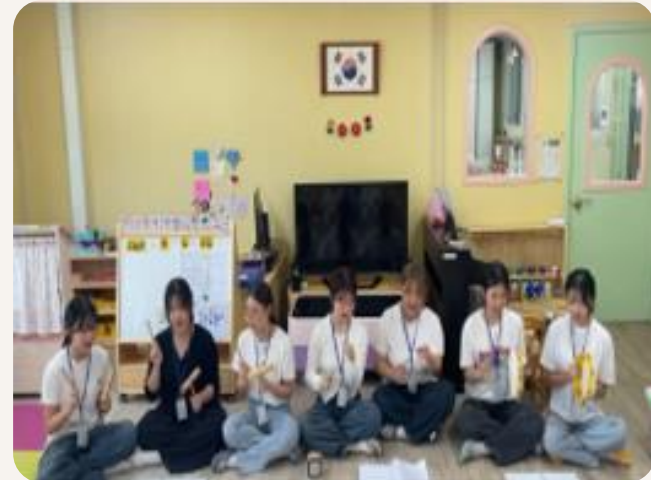
지역사회 교육기부 프로그램