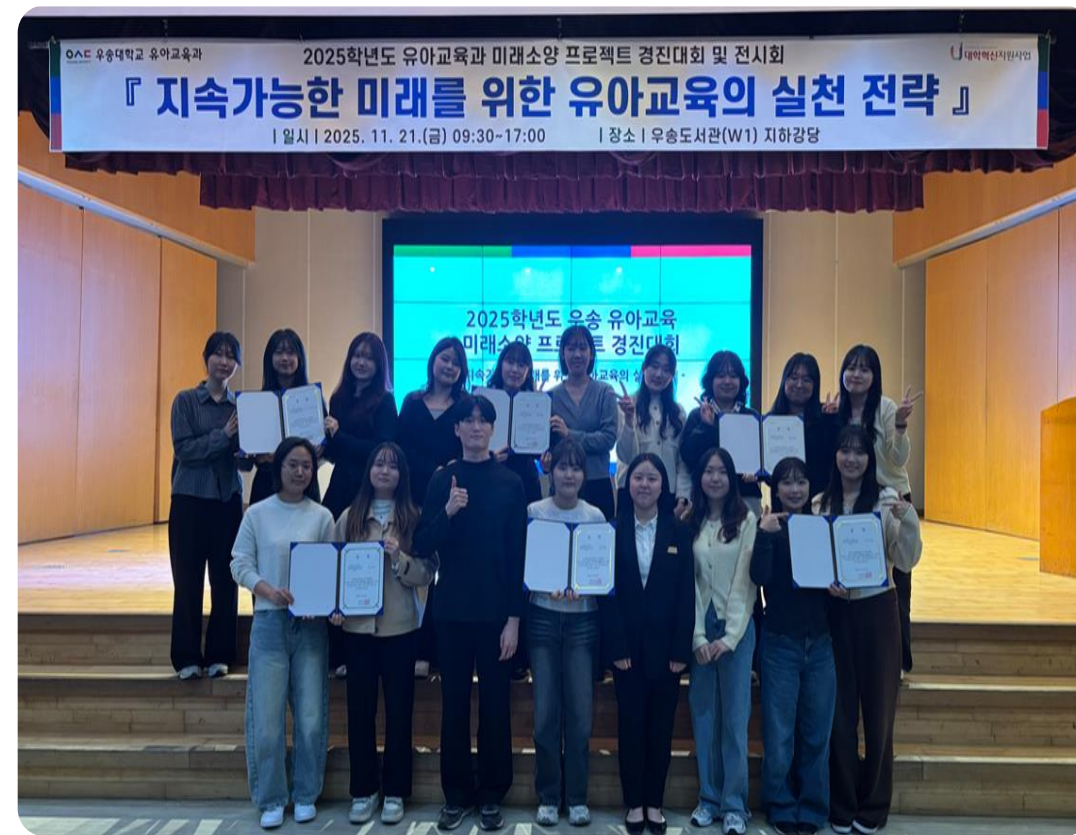
지속가능한 미래를 위한 유아교육 관련 분석 및 연구