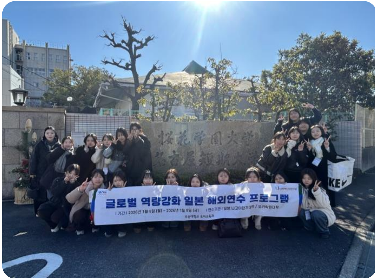
일본 나고야단기대학, 오오카학원대학