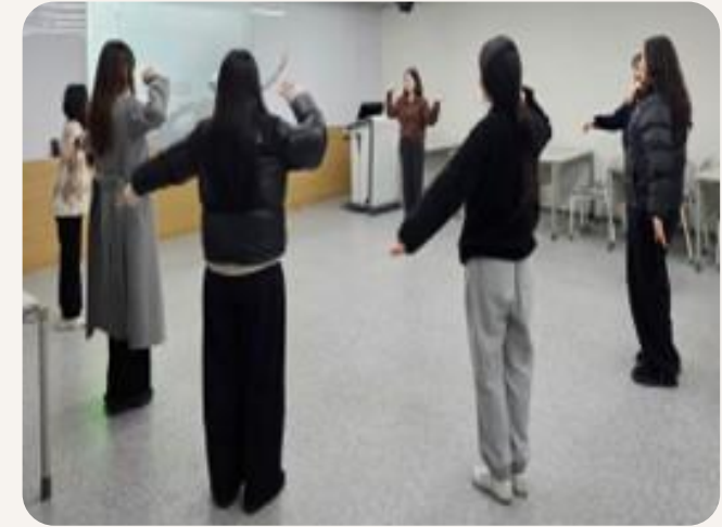
수업 실행 특강