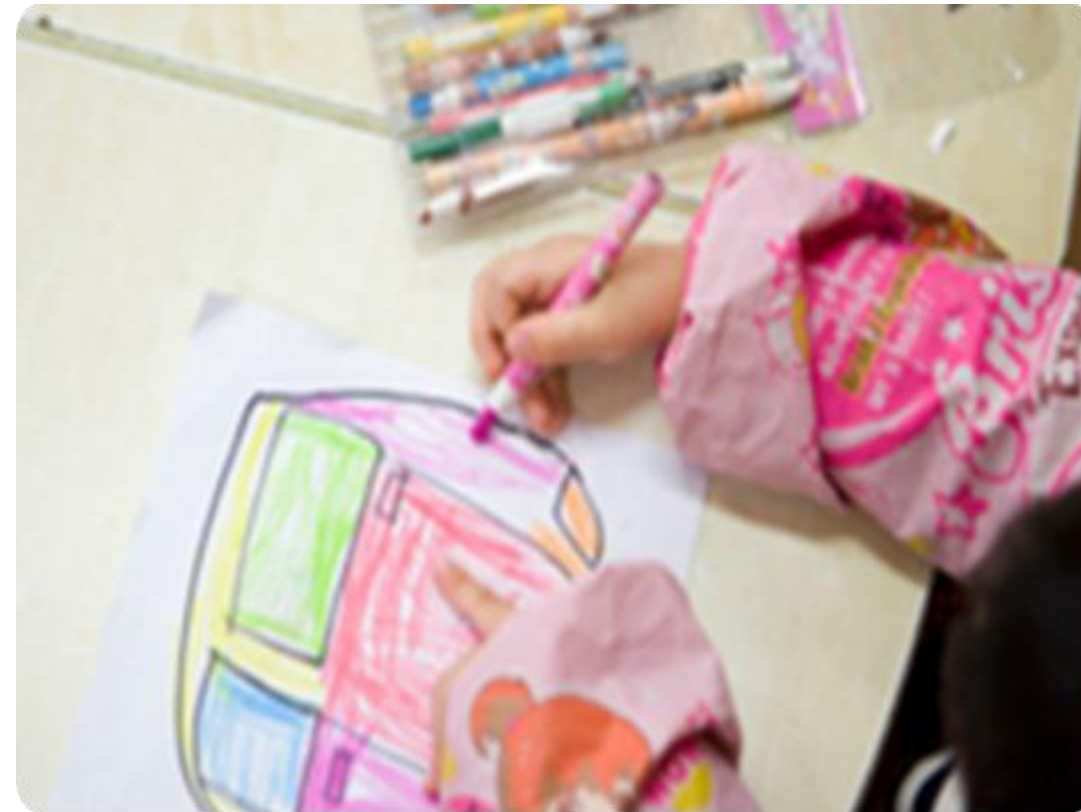
어린이 교육복지연구소 I-SOL