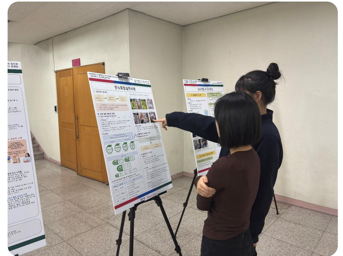
연구 성과 포스터 전시 및 관람