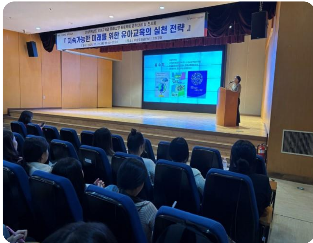
지속가능한 미래를 위한 유아교육 특강